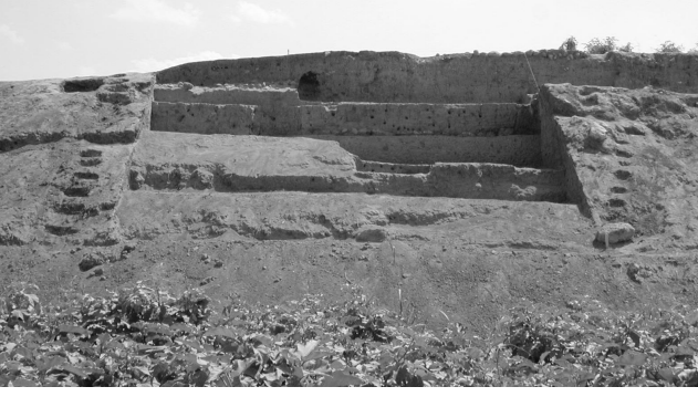
Kavuşan Höyük, Basamaklı Açma, kuzeyden

döşeme üzerine yerleştirilmiş tandırlar ve taş duvarlardan oluşur. Geç evrede ise çoğu tahrip olmuş, doğu - batı yönlü, basit toprak mezar kalıntıları bulunmaktadır. Mezarların ait olduğu yerleşim olasılıkla, Şeyhan Çayı'nın batısında, üzerinde benzer çanak çömlek bulunan Kavuşan 2 Tepesi'nde bulunmaktadır.