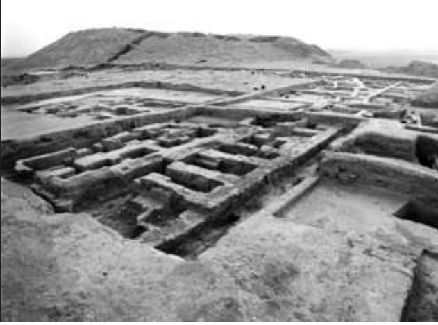
Tell Knedig Höyüğü

da yerleşme tamamı ile terk edilmiştir. Aşağı Habur antik yerleşmelerinin çoğu M.Ö. III. binyılın sonunda terk edilmiş ve ancak daha geç dönemlerde tekrar iskan görmüştür.